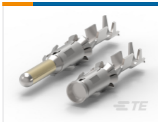
TE 产品编号1703014-1 圆形连接器系统，插针和插座