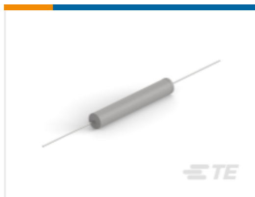
TE 产品编号1-2176416-1 9W STD M/OX 5% 130R