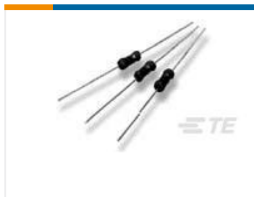
TE 产品编号3-1879355-5 RR03 5% 110K AMMO