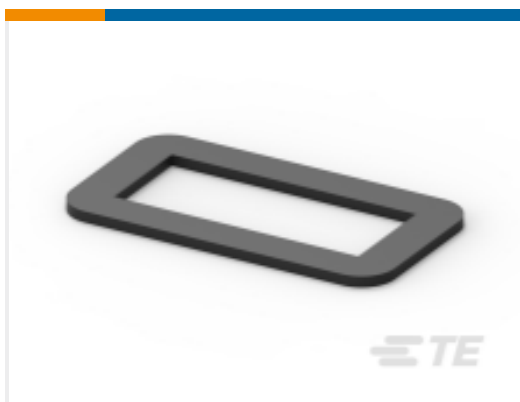
TE 产品编号DRC40-GKT GASKET, 40P, BLK, DRC16