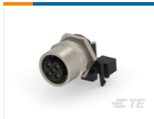
TE 产品编号T4145015041-001 M12 R/A F PNLREAR STAMPED PIN A-CODE 4P