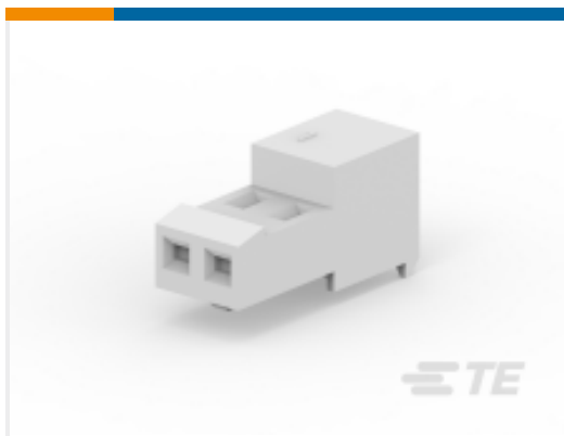
TE 产品编号3-640440-5 MTA Receptacle: Nylon, Tin Plated, 2.54 mm