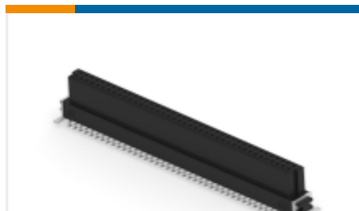
TE 产品编号154721-E SMCB 80 F AB VV 7-03 CL * H007 137 E002