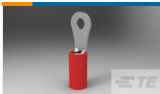
TE 产品编号320553 PIDG R 22-16 COMM 22-18 MIL 4