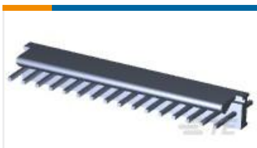
TE 产品编号1-640456-6 16P MTA100 HDR ASSY F/L SQ STR