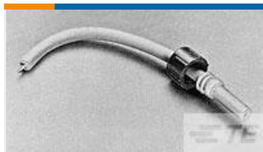
TE 产品编号1-830611-1 LGH 1/2 SGL END MLD LEAD