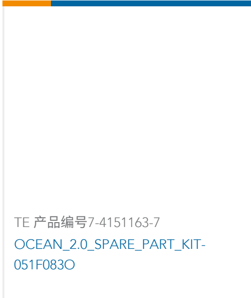
TE 产品编号7-4151163-7 OCEAN_2.0_SPARE_PART_KIT-051F083O