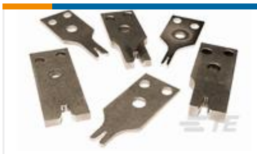
TE 产品编号3-2119784-2 CRIMPER, INSULATION