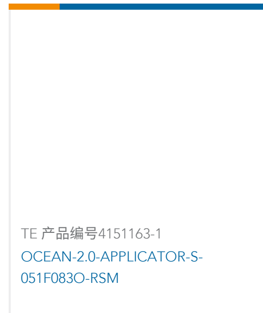
TE 产品编号4151163-1 OCEAN-2.0-APPLICATOR-S-051F083O-RSM