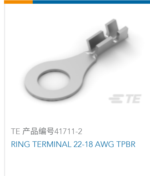
TE 产品编号41711-2 RING TERMINAL 22-18 AWG TPBR