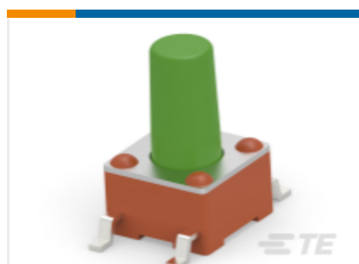
TE 产品编号2-1977223-4 FSM8JSMASSTR=6MM TACT SWITCH, SMT 160gf,