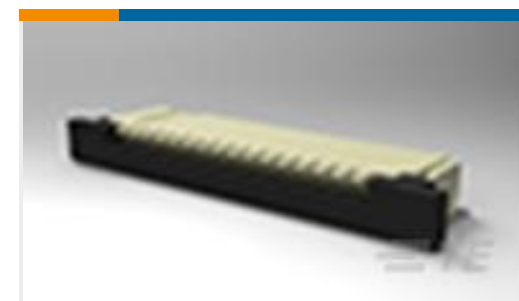
TE 产品编号2-84953-0 1MM FPC HORZ.TOP CONT.ASSY 20P