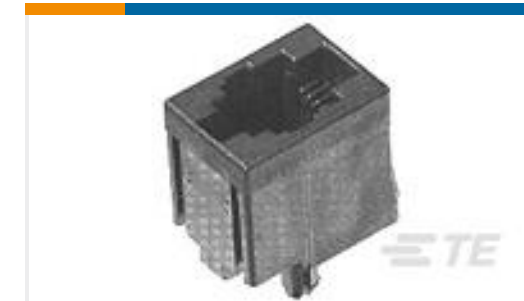
TE 产品编号5520257-2 MJ,TE,4P,PNL STOPS