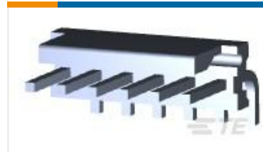
TE 产品编号640389-6 06P MTA156 HDR ASSY SQ R/A F/L