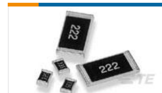
TE 产品编号1-2176177-5 CRGH0603 1% 2K2 0.2W