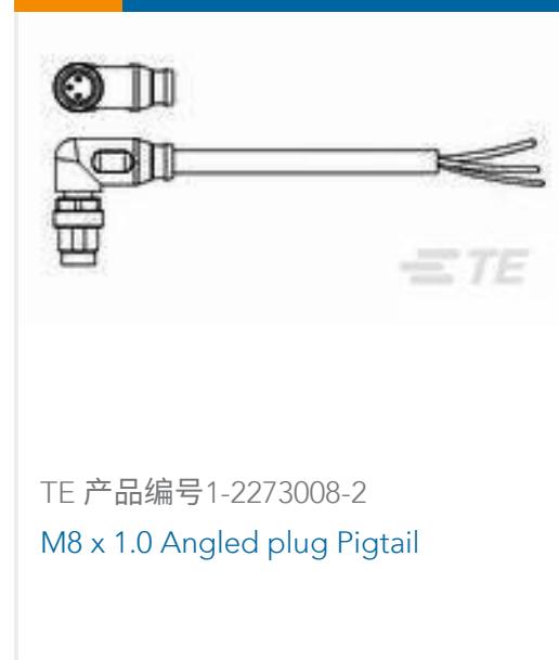
TE 产品编号1-2273008-2 M8 x 1.0 Angled plug Pigtail