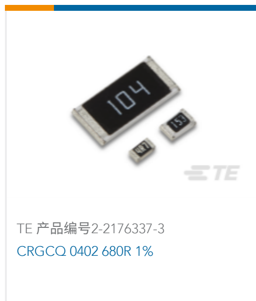
TE 产品编号2-2176337-3 CRGCQ 0402 680R 1%