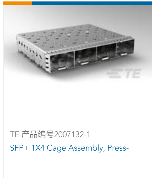
TE 产品编号2007132-1 SFP+ 1X4 Cage Assembly, Press-