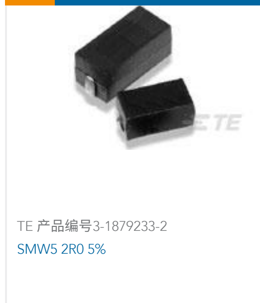
TE 产品编号3-1879233-2 SMW5 2R0 5%