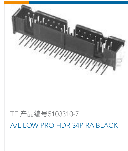
TE 产品编号5103310-7 A/L LOW PRO HDR 34P RA BLACK