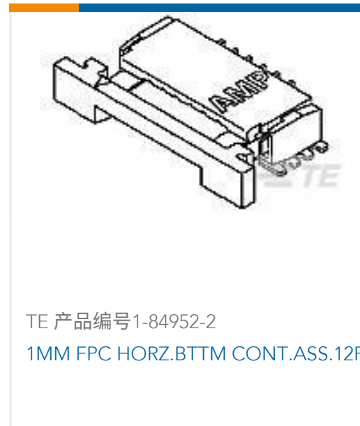
TE 产品编号1-84952-2 1MM FPC HORZ.BTTM CONT.ASS.12P