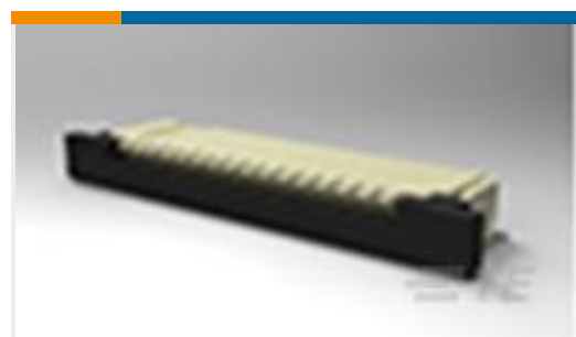
TE 产品编号 1-84953-7 1MM FPC HORZ.TOP CONT.ASSY 17P