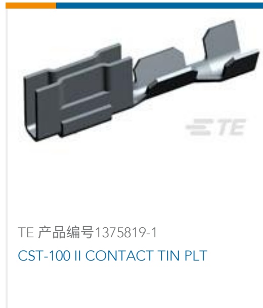
TE 产品编号1375819-1 CST-100 II CONTACT TIN PLT