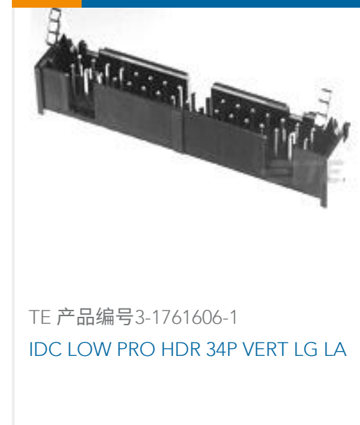
TE 产品编号3-1761606-1 IDC LOW PRO HDR 34P VERT LG LA