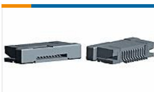
TE 产品编号2-1734592-9 FPC CONN. 0.5MM PITCH B/C, 29P