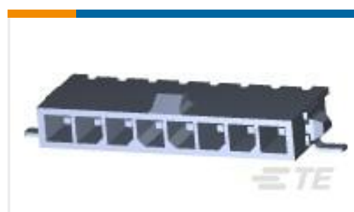
TE 产品编号2-1445100-8 MICRO MNL HDR ASSY S/ROW LF