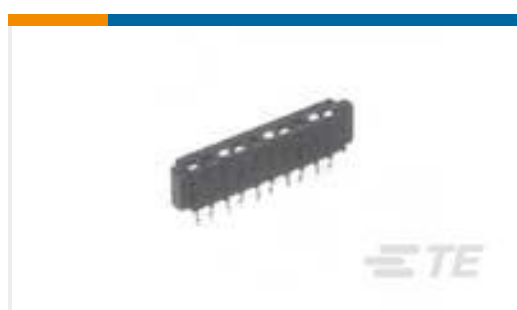
TE 产品编号5-520315-3 TRIOMATE ASSY V 3P L=3.556LDFR