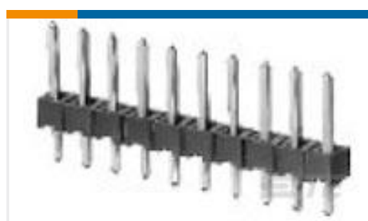
TE 产品编号5-146281-6 06 MODII HDR SRST B/A .100CL