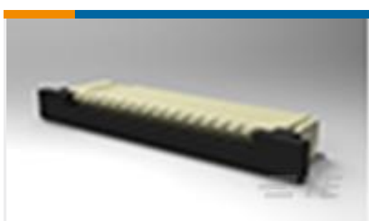
TE 产品编号 1-84953-3 1MM FPC HORZ.TOP CONT.ASSY 13P