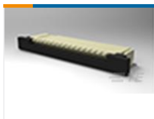
TE 产品编号 1-84953-2 1MM FPC HORZ.TOP CONT.ASSY 12P