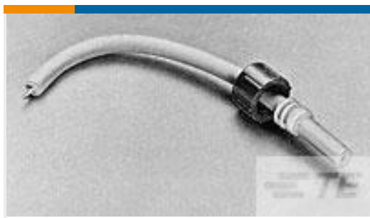
TE 产品编号4-837655-5 LEAD, SGL END ASSY, LGH