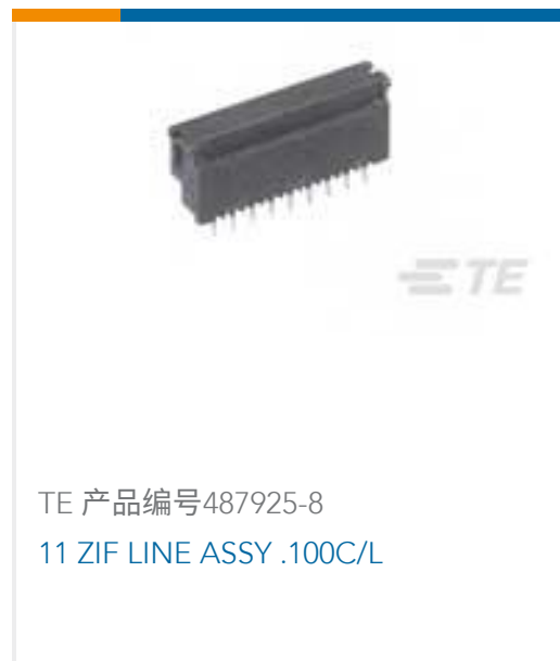
TE 产品编号487925-8 11 ZIF LINE ASSY .100C/L