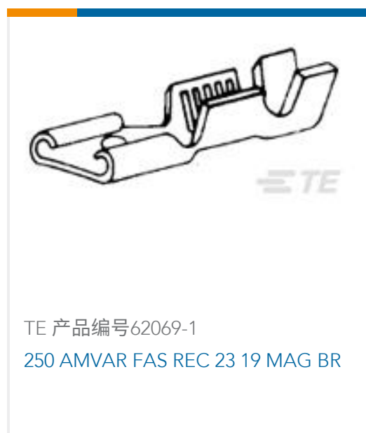
TE 产品编号62069-1 250 AMVAR FAS REC 23 19 MAG BR