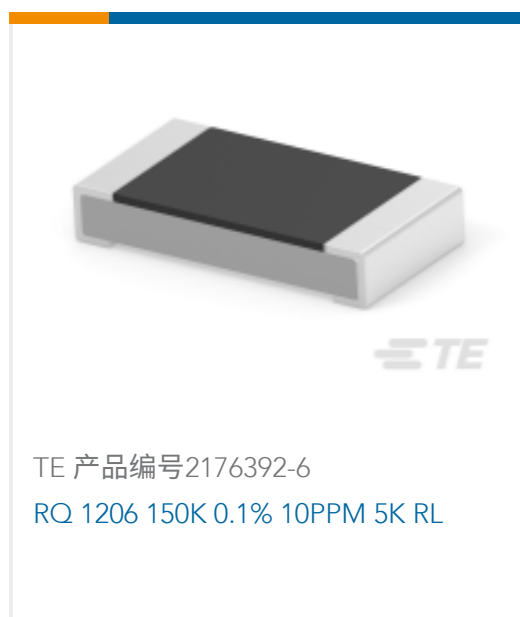
TE 产品编号2176392-6 RQ 1206 150K 0.1% 10PPM 5K RL