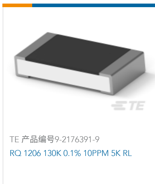
TE 产品编号9-2176391-9 RQ 1206 130K 0.1% 10PPM 5K RL