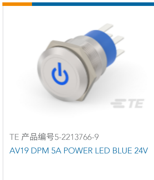
TE 产品编号5-2213766-9 AV19 DPM 5A POWER LED BLUE 24V