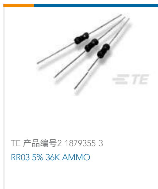
TE 产品编号2-1879355-3 RR03 5% 36K AMMO