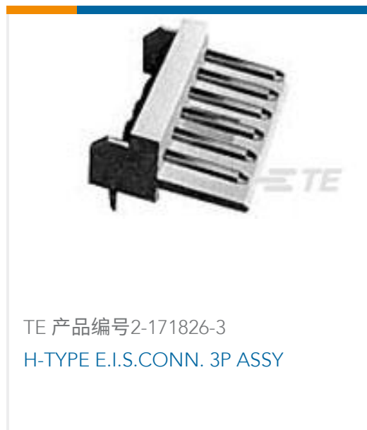
TE 产品编号2-171826-3 H-TYPE E.I.S.CONN. 3P ASSY