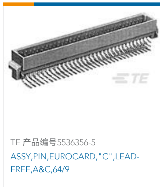
TE 产品编号5536356-5 ASSY, PIN, EUROCARD, "C", LEAD-FREE, A&C, 64/9