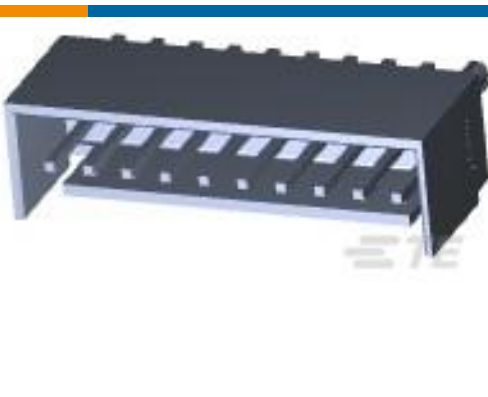
TE 产品编号4-644893-0 10P CST100 SHRD HDR ASSY LF