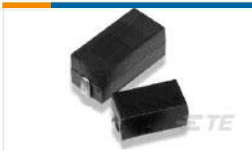
TE 产品编号7-1879234-5 SMF5 620K 5%