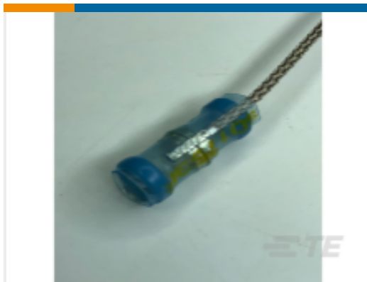
TE 产品编号F31839-000 SO63-1-W2-24-00-100