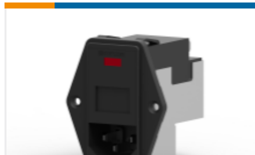
TE 产品编号9-6609930-1 PE000SH3A=C2405