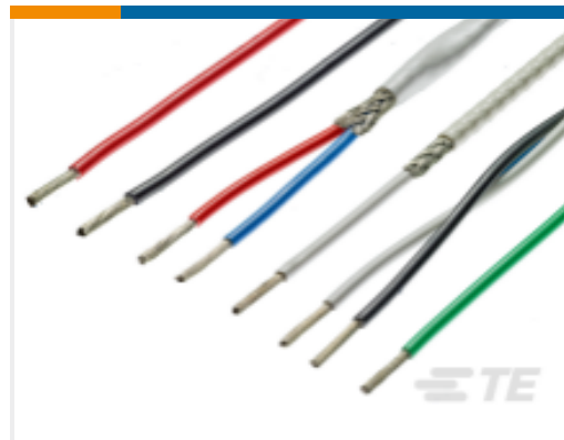
TE 产品编号9682553004 FLDWC0311-0.50-5