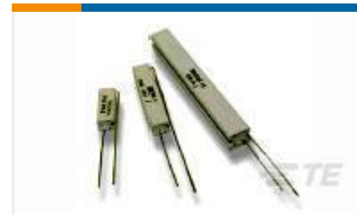
TE 产品编号1623727-2 SBCH 7 22R 5%