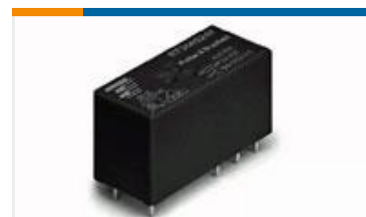
TE 产品编号2-1393237-7 RT334024F