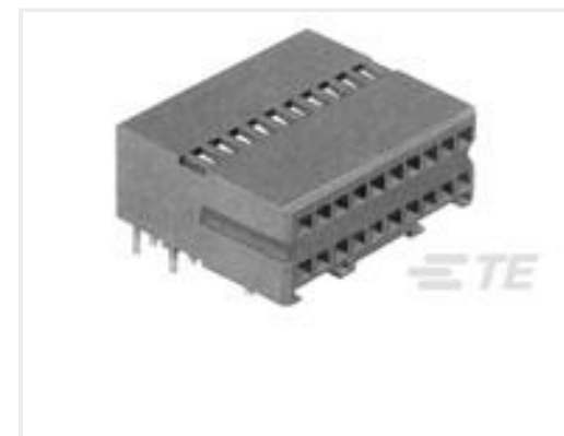
TE 产品编号5-103911-3 60 SYSTEM 50 RCPT ASSY DRRA