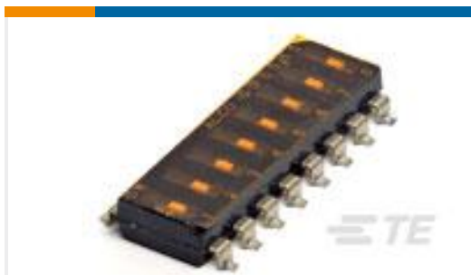
TE 产品编号1-1825006-9 GDS10S04=DIP SW,SLIDE,SMT