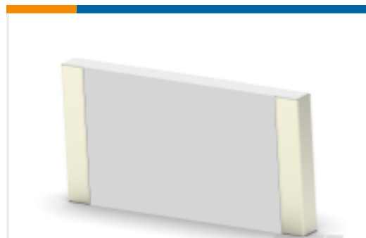
TE 产品编号7-2176246-6 CRGS2512 5% 1M8