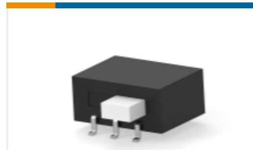
TE 产品编号1-1437581-1 ASE22RL=AUTOSLIDE DP 0.3W