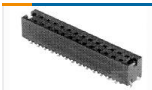
TE 产品编号 1-1355347-3 2x13P HV100 REC. CON, SMD, TIN, BLISTER