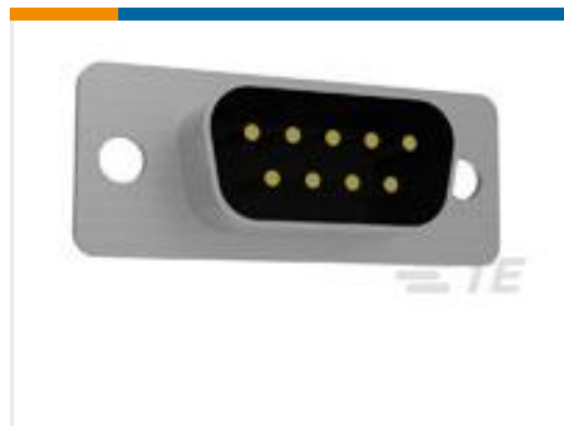
TE 产品编号5-747904-2 9 Plug Solder Cup, Gold Flash,