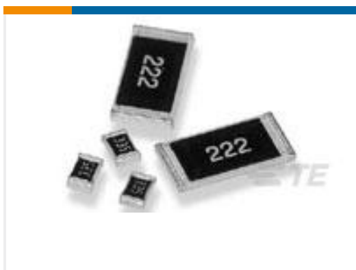
TE 产品编号1623440-1 CRG1206 1% 1K0