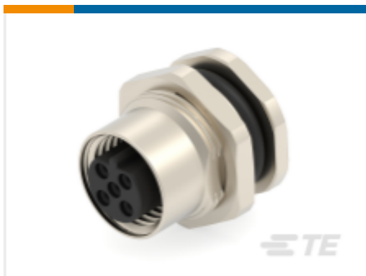
TE 产品编号T4131412041-000 M12,REAR MOUNT,FEMALE,B,4P, SOLDER WIRE