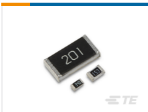
TE 产品编号2176326-1 CRGP 0603 10R 1%