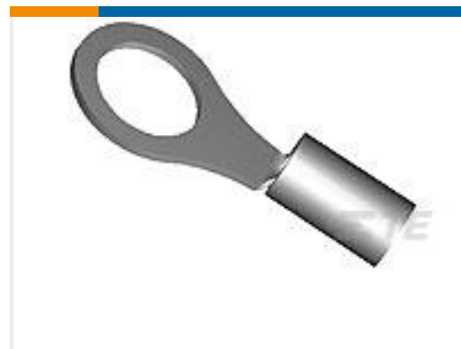
TE 产品编号342144-1 16-14 F.E.P/G RING TONGUE