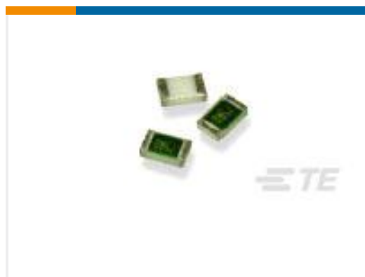
TE 产品编号1-1614884-0 CPF 0805 5R1 0.1% 25PPM 1K RL