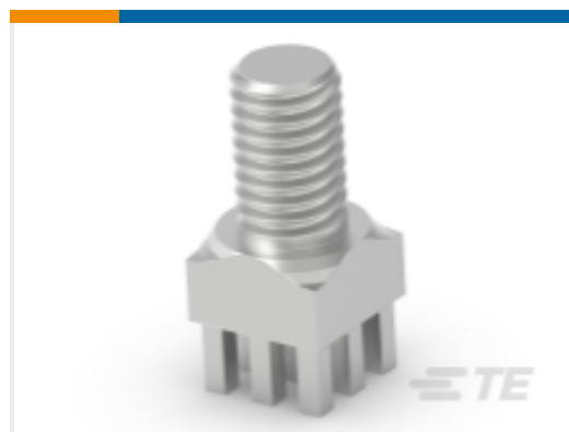
TE 产品编号225777-E POWELM STIFT VOLLM M5 8 2,54 * EP 4,0 *