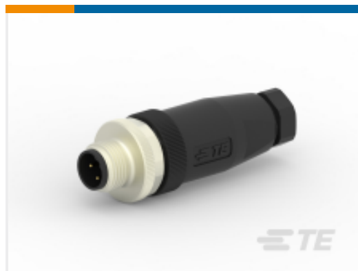
TE 产品编号T4111401041-000 M12,MALE,STRAIGHT,B CODE,4P, PG7,GOLD