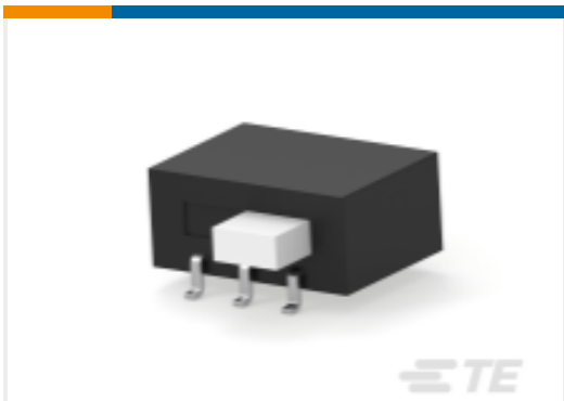
TE 产品编号1-1437581-1 ASE22RL=AUTOSLIDE DP