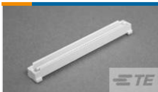
TE 零件编号5177986-4 0.8FH,P05H.5,100,08/Sn,TR, SC