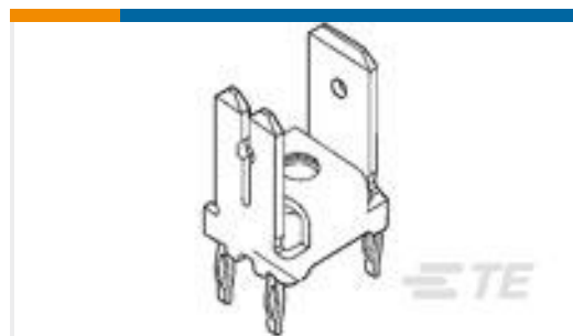
TE 零件编号216905-1 POSITIVE LOCK POWER RECEPTACLE TPPHBRZ