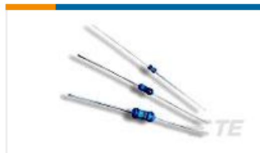
TE 零件编号1879026-1 YR1 0.1% 10R2