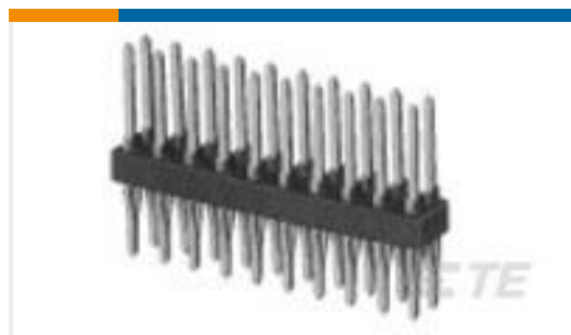
TE 零件编号6-969982-8 AMPMODU II Action Pin Header, dual row