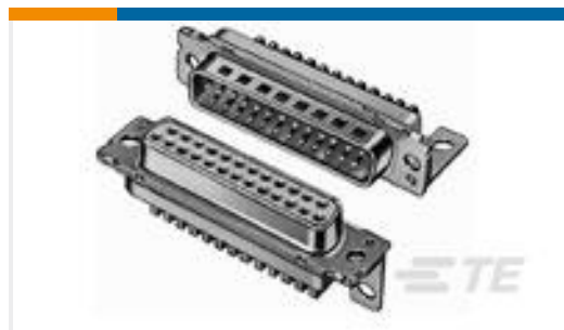
TE 零件编号1393481-5 V23529B1225C209=SUB D STIFTLEI