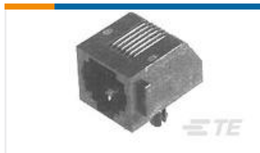
TE 零件编号5569026-1 MJ,LPF,R/A,6P,HTN