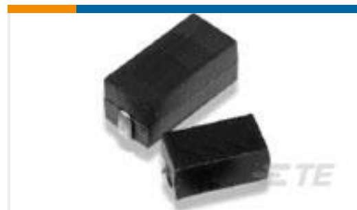
TE 零件编号4-1879021-7 SMW3 8R2 5%