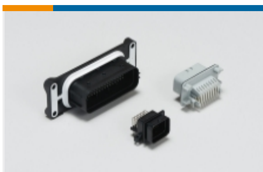
用于汽车、卡车、大巴和非 公路车辆的接头(1)