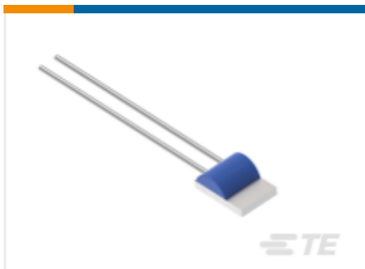
TE 产品编号NB-PTCO-157 Pt1000, 2.0x2.3, Class B, PTFC102B1A0