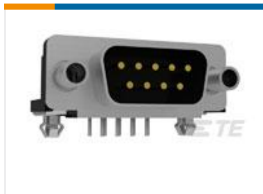
TE 产品编号5747840-6 HD-20 PLUG RA .318 FMS BD-LK S