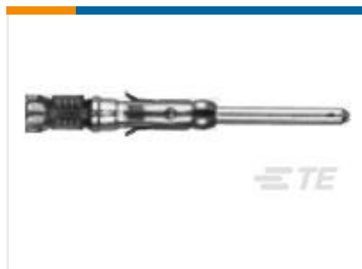
TE 产品编号1-1105000-3 HD.M-C-STI.SN.0,3