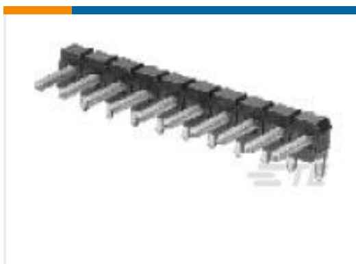
TE 产品编号5-826947-0 MOD2 PIN HEADER 50P