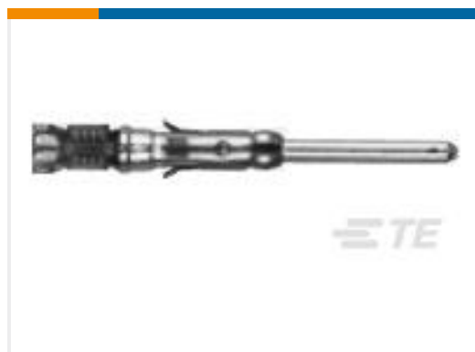
TE 产品编号2-1105000-3 HD.M-C-STI.SN.0,5