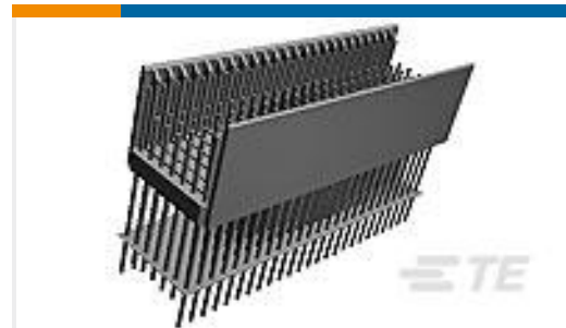
TE 产品编号5100785-1 2MM HDR, 125 POS 9.7MM