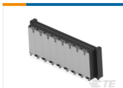
TE 产品编号354180-E MSPEED 50 F SMD F10 B AB W 137 094 **