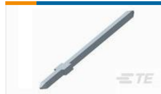
TE 产品编号1-928776-4 MOD2 STIFT M A-PIN