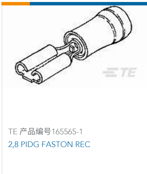
TE 产品编号165565-1 2,8 PIDG FASTON REC