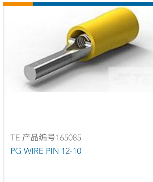
TE 产品编号165085 PG WIRE PIN 12-10