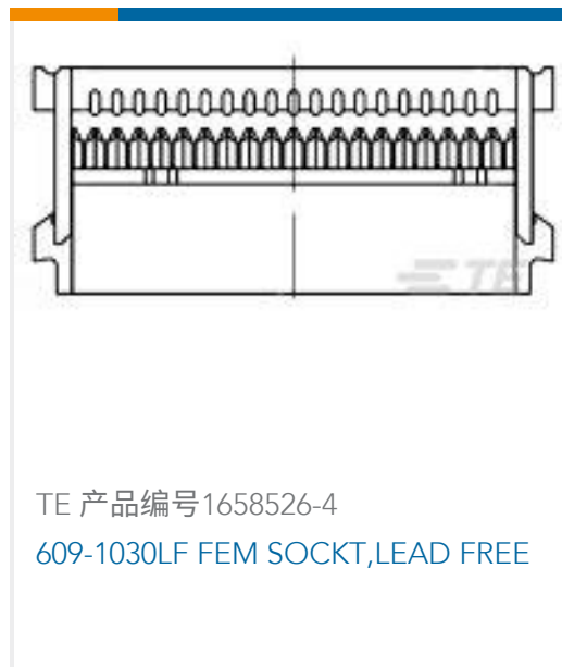
TE 产品编号1658526-4 609-1030LF FEM SOCKET,LEAD FREE