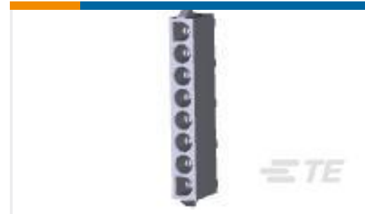
TE 产品编号643410-1 08P UMNL PIN HDR ASSY POL 94VO