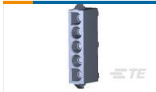
TE 产品编号640901-1 05P UMNL SOK HDR ASSY 94VO