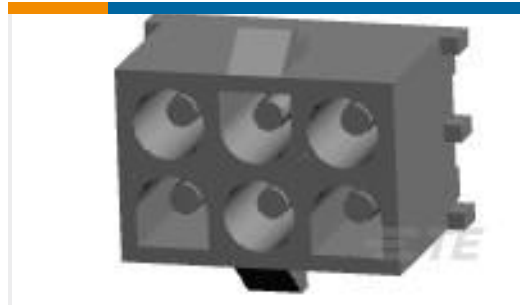
TE 产品编号350431-1 06P UMNL PIN HDR ASSY V2 NAT