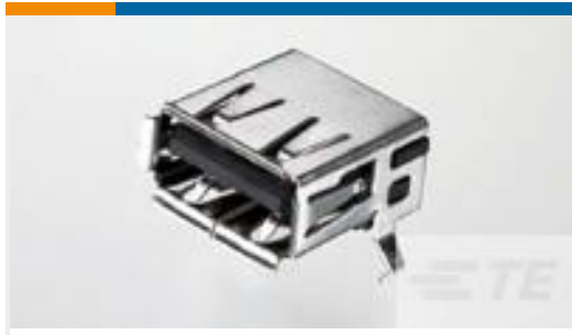
TE 产品编号292303-1 Std USB Type A, R/A, T/H