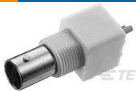
TE 产品编号 5227222-3 VERT JK W/MTG PINS, BNC PCB