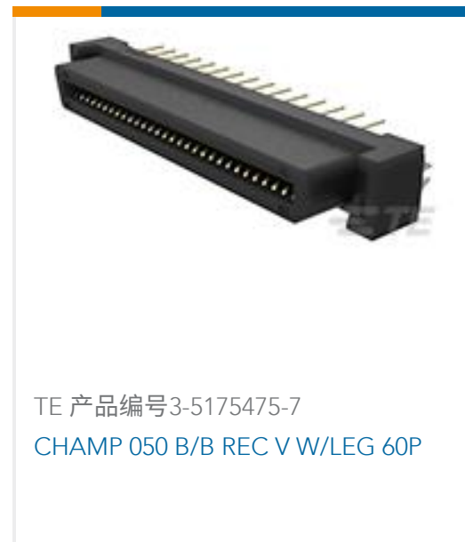
TE 产品编号3-5175475-7 CHAMP 050 B/B REC V W/LEG 60P