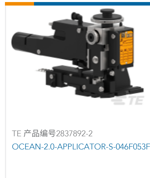
TE 产品编号2837892-2 OCEAN-2.0-APPLICATOR-S-046F053F