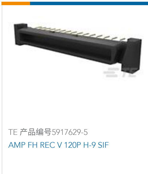
TE 产品编号5917629-5 AMP FH REC V 120P H-9 SIF