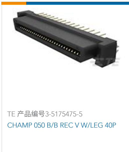
TE 产品编号3-5175475-5 CHAMP 050 B/B REC V W/LEG 40P