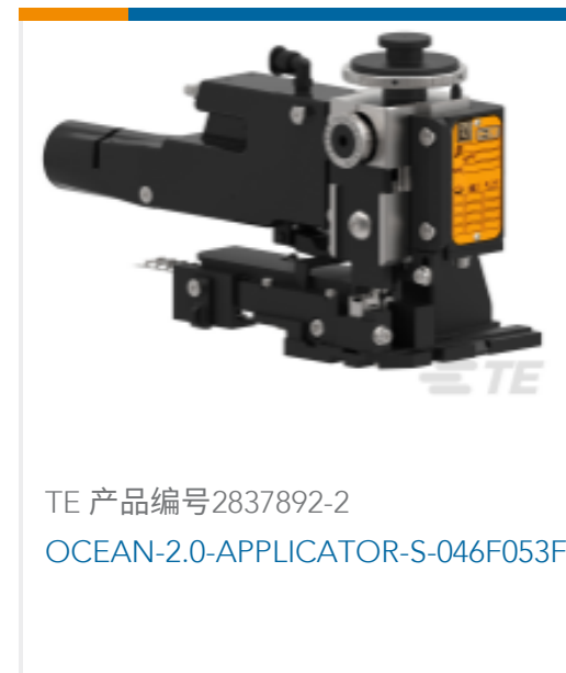
TE 产品编号2837892-2 OCEAN-2.0-APPLICATOR-S-046F053F