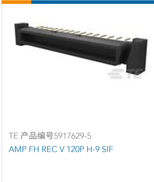
TE 产品编号5917629-5 AMP FH REC V 120P H-9 SIF