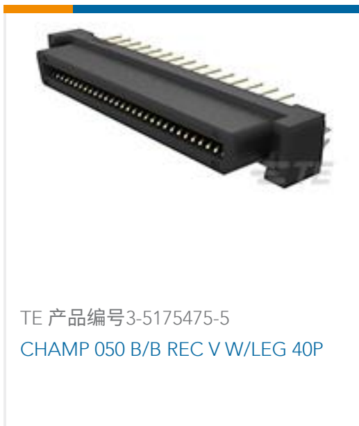
TE 产品编号3-5175475-5 CHAMP 050 B/B REC V W/LEG 40P