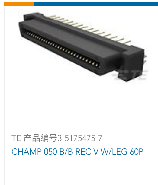
TE 产品编号3-5175475-7 CHAMP 050 B/B REC V W/LEG 60P