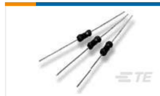
TE 产品编号9-1879352-1 RR02 5% 1K8 AMMO