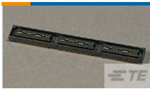
TE 产品编号2-1658012-3 MSB0.80RC-ASY120FL-,10,-TY