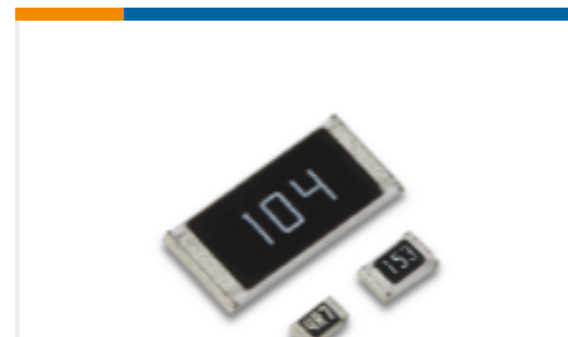
TE 产品编号2176347-6 CRGCO 2010 27R 1%