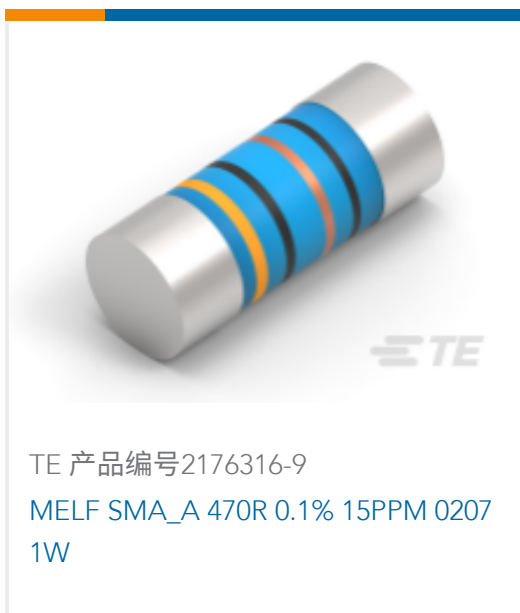
TE 产品编号2176316-9 MELF SMA_A 470R 0.1% 15PPM 0207 1W