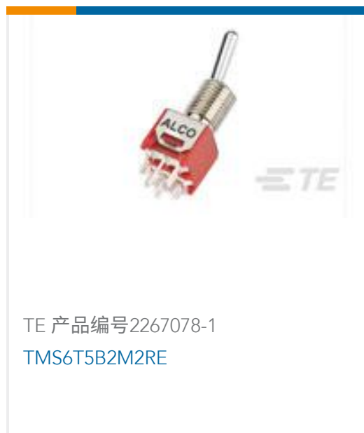
TE 产品编号2267078-1 TMS6T5B2M2RE