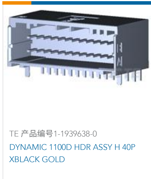
TE 产品编号1-1939638-0 DYNAMIC 1100D HDR ASSY H 40P XBLACK GOLD