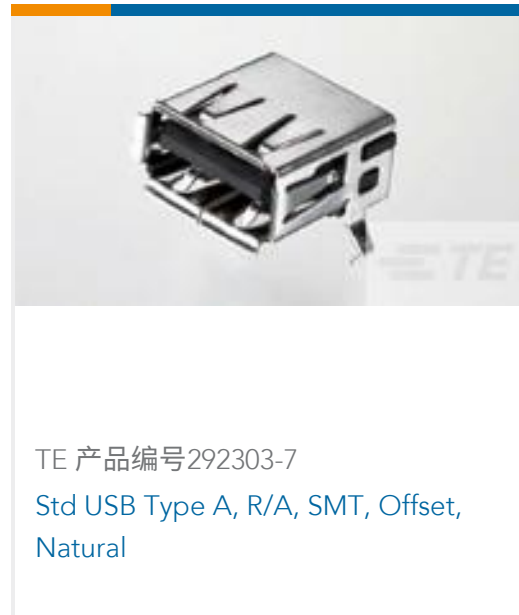
TE 产品编号292303-7 Std USB Type A, R/A, SMT, Offset, Natural