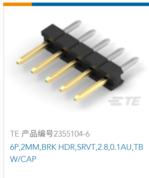
TE 产品编号2355104-6 6P,2MM,BRK HDR,SRVT,2.8,0.1AU,TB W/CAP