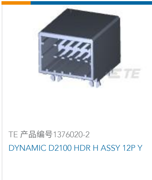
TE 产品编号1376020-2 DYNAMIC D2100 HDR H ASSY 12P Y