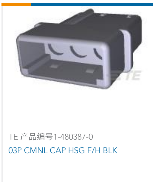
TE 产品编号1-480387-0 03P CMNL CAP HSG F/H BLK