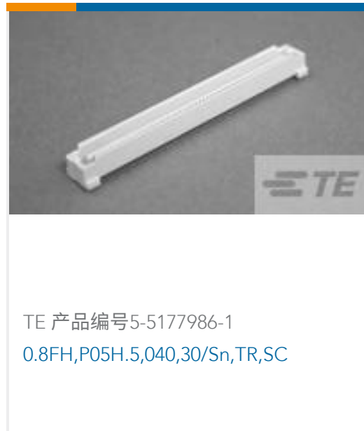
TE 产品编号5-5177986-1 0.8FH,P05H.5,040,30/Sn,TR,SC