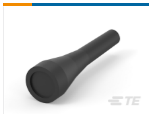
TE 产品编号 207489-1 FLEXIBLE CABLE BOOT, SIZE 11