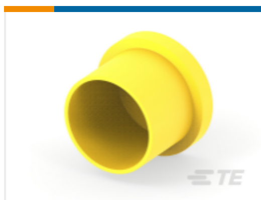
TE 产品编号 1-2407269-4 CAP, CPC, SIZE 11 RECP & 13 PLUG, YELLOW