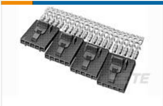
TE 产品编号5-103960-1 10X2 MTE RCPT SR LATCH .100CL