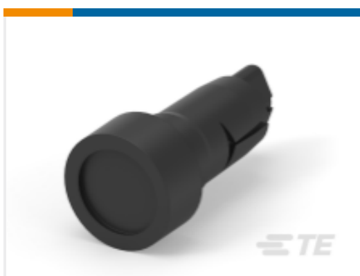
TE 产品编号 207490-1 CABLE GRIPPER, SIZE 11