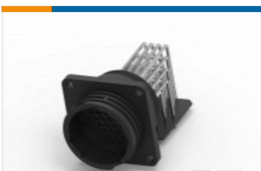
TE 产品编号1-796375-1 Connectors with Posted Pin Contacts, CPC Series 1