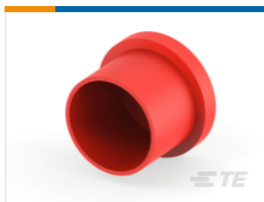
TE 产品编号 1-2407269-3 CAP, CPC, SIZE 11 RECP & 13 PLUG, RED