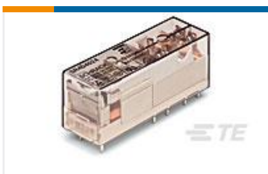
TE 产品编号3-1415055-1 SR4D4024