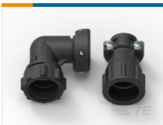
TE 产品编号 CAT-AM71-C83998B CPC Cable Clamps