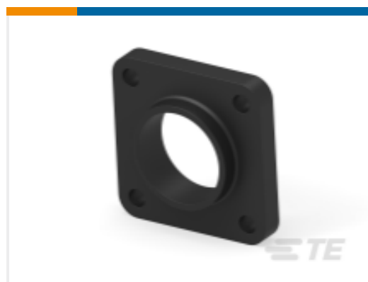
TE 产品编号 207299-1 PLUG MTG. FLANGE NO 11 CPC