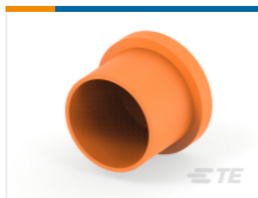
TE 产品编号 1-2407269-1 CAP, CPC, SIZE 11 RECP & 13 PLUG, ORANGE