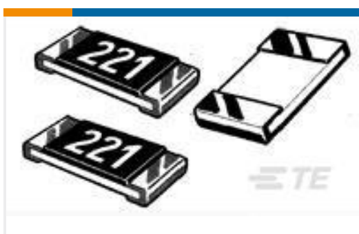
TE 产品编号8-2176070-6 3521 36K 1% 2W