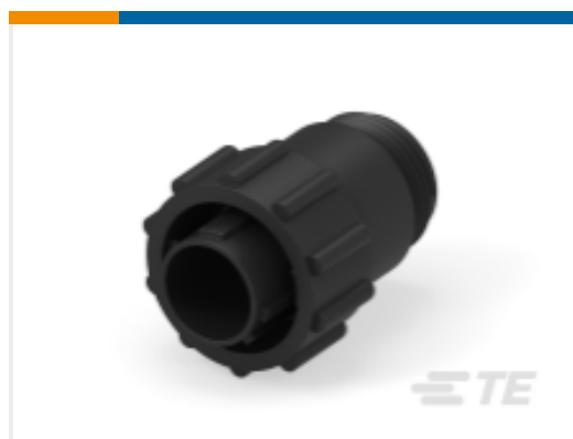
TE 产品编号 206429-1 CPC PLUG ASSY, 11-4, REV SEX