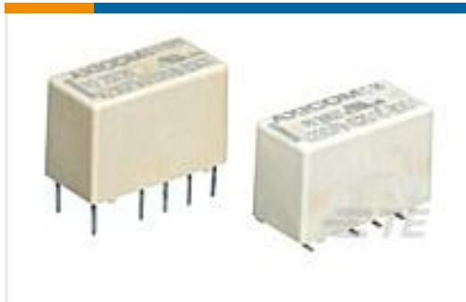
TE 产品编号1-1393788-6 V23079A1005B301