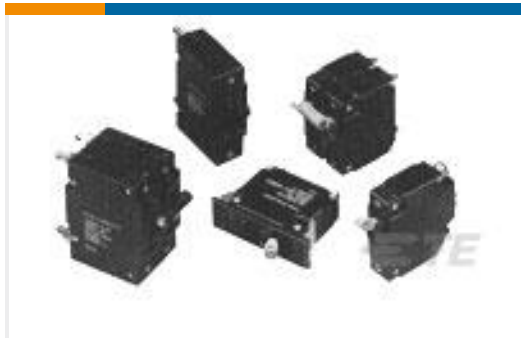
TE 产品编号5-1393252-5 W67-X2Q12-10=M6/M7/M9/W6/W7