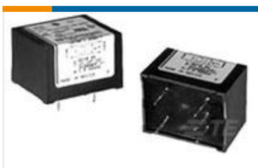
TE 产品编号6609065-4 10EDP=F7690 S0