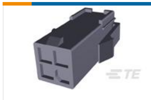
TE 产品编号794939-1 04P MINI UMNL CAP HSG