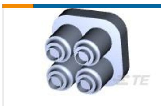
TE 产品编号1586359-4 04P MINIUMNL GANG WIRE SEAL DR