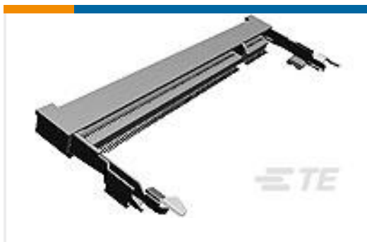
TE 产品编号1565691-1 SEMI-HARD TRAY ASS'Y FOR DDR S