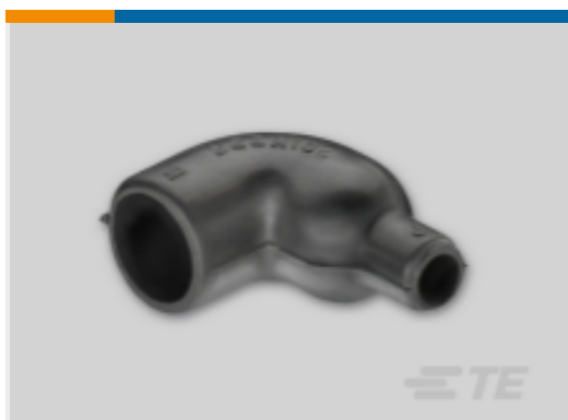
TE 产品编号214479-000 222A121-100/86-0