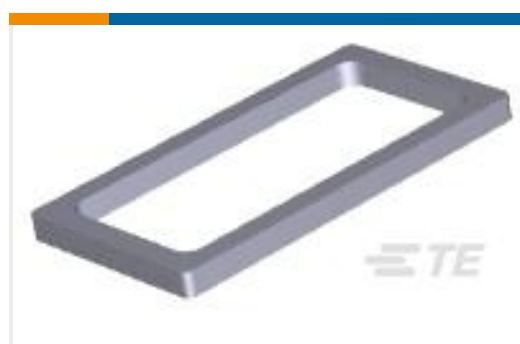
TE 产品编号794772-4 04P MINI UMNL SEAL,DIE CUT