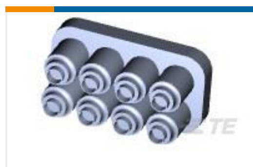
TE 产品编号1586359-8 08P MINIUMNL GANG WIRE SEAL DR