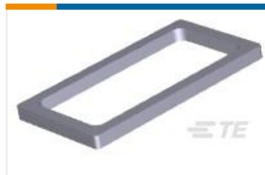
TE 产品编号794772-6 06P MINI UMNL SEAL,DIE CUT