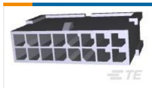
TE 产品编号1-794616-6 FREE HANG DBL ROW HSG 16 POS