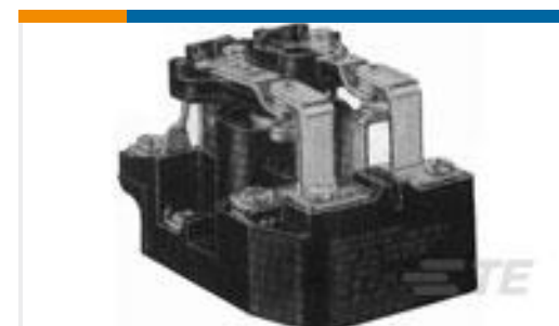
TE 产品编号6-1393127-1 PRD-11DY0-12=PRD