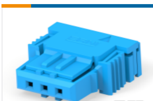
TE 产品编号364213-E SRCBUG A 2,54 2 3 CSI 163 E1 ADV J 2 324