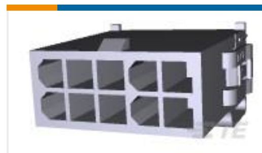
TE 产品编号794197-1 10P MINI UMNL2 CAP HSG UL94V0