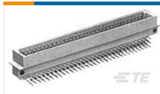
TE 产品编号106276-4 32P.IEC-C/2 M.CONN.