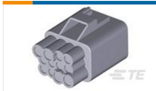
TE 产品编号1452303-2 INL:R.BUM.MAL HSG12