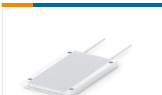
TE 产品编号1-2176249-8 TJT 300W 680R 5%