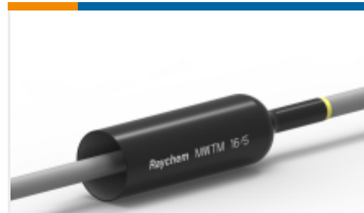
TE 产品编号F17194-000 MWTM-16/5-1000-23/S