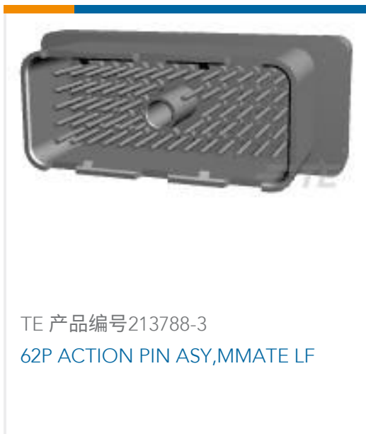
TE 产品编号213788-3 62P ACTION PIN ASY,MMATE LF