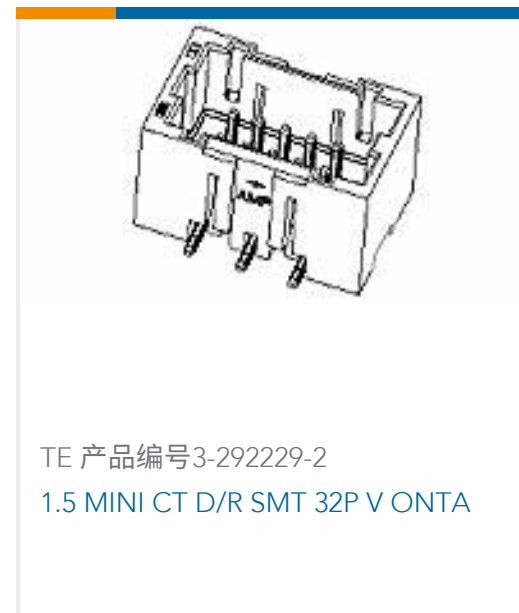
TE 产品编号3-292229-2 1.5 MINI CT D/R SMT 32P V ONTA