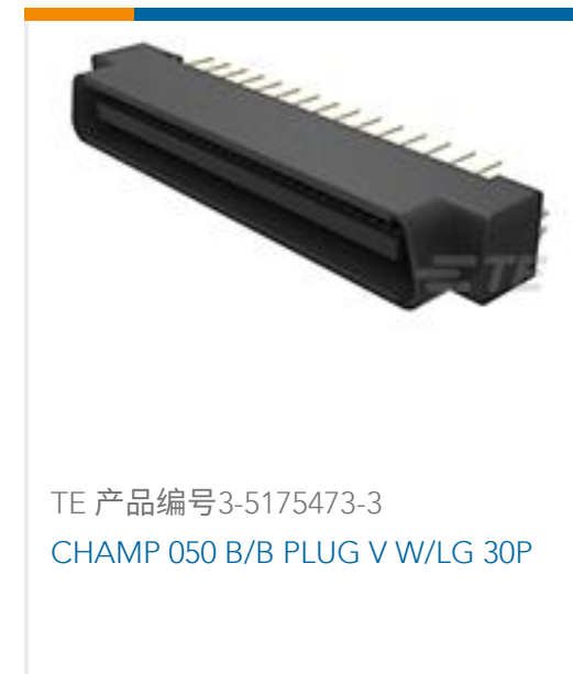
TE 产品编号3-5175473-3 CHAMP 050 B/B PLUG V W/LG 30P