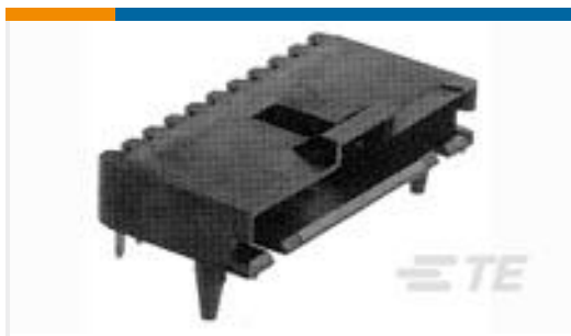
TE 产品编号5-104361-8 09 MTE HDR SRRA LATCH W/HLDWN