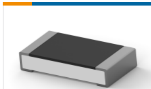
TE 产品编号5-2176383-2 RQ 1206 34R 0.1% 10PPM 1K RL