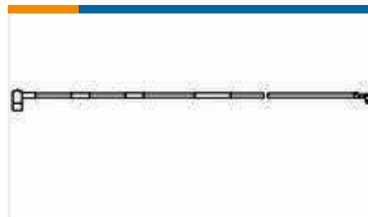
TE 产品编号1559047-1 SMB TO HIROSE COAX CONTACT