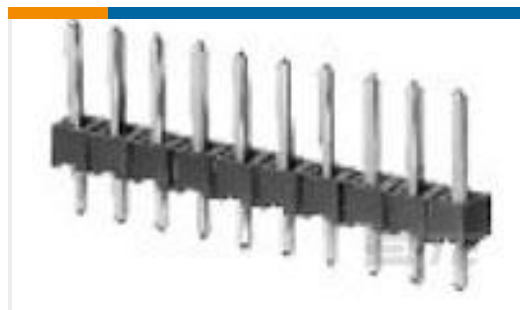
TE 产品编号5-146282-5 05 MODII HDR SRST B/A .100CL