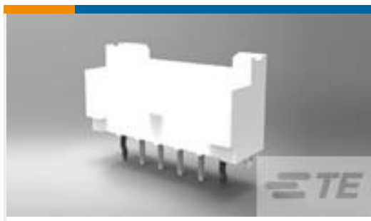
TE 产品编号1744418-7 7 POS EP 2.5 HDR, GLOW WIRE