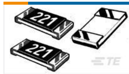
TE 产品编号5-2176231-9 3522 2K7 1% 3W