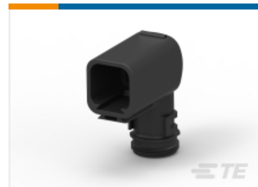
TE 产品编号1011-270-0605 BKSHL, 6P, BLK, REC, RA, SR, NW8.5 /10/13