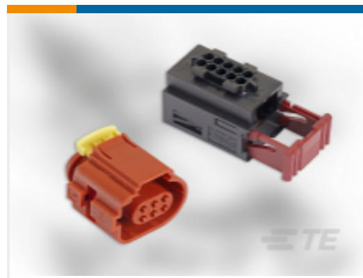
TE 产品编号1-967629-4 Timer Connector Housing