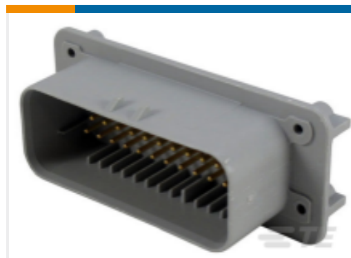
TE 产品编号1-776180-4 35POS,AMPSEAL,PIN HSG ASSY,SLD, COD 4