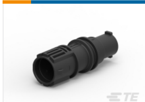
TE 产品编号DTSK04-1-08PB RECEPTACLE, INLINE, KEY B