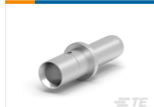
TE 产品编号SRK-PC-080-25-601 PIN, SOLID, SIZE M8, 25mm2, AG