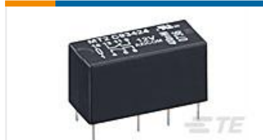
TE 产品编号6-1462000-2 C93432=MT Relay 550 mW 12 V