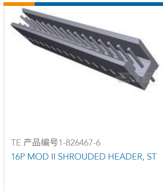
TE 产品编号1-826467-6 16P MOD II SHROUDED HEADER, ST