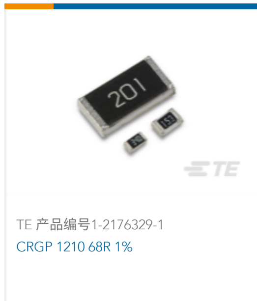
TE 产品编号1-2176329-1 CRGP 1210 68R 1%