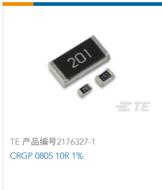
TE 产品编号2176327-1 CRGP 0805 10R 1%