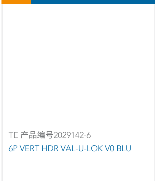
TE 产品编号2029142-6 6P VERT HDR VAL-U-LOK V0 BLU