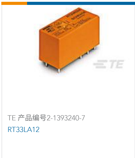
TE 产品编号2-1393240-7 RT33LA12