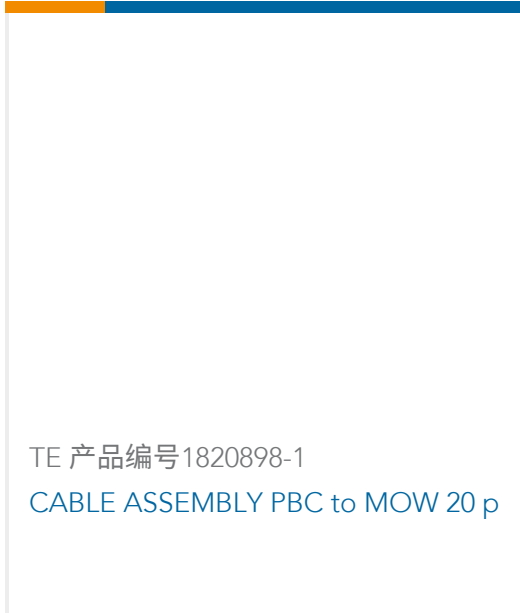
TE 产品编号1820898-1 CABLE ASSEMBLY PBC to MOW 20 p