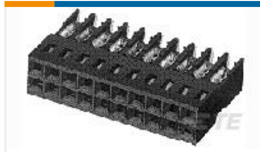
TE 产品编号5-102398-5 14 AMPMODU MT ASSY DR.100CL SN