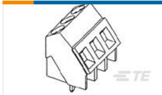
TE 产品编号282847-8 TERMI-BLOK PCB MOUNT 35 8P.5