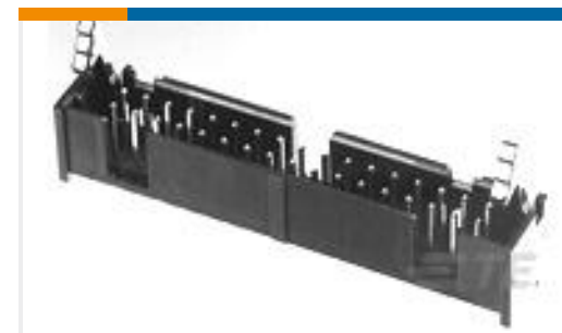
TE 产品编号2-1761608-9 IDC LOW PRO HDR 26P VERT SHT LAT BLUE