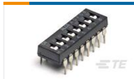
TE 产品编号1-1825002-3 ADF0804=DIP SWT,FLUSH,THRU/HL