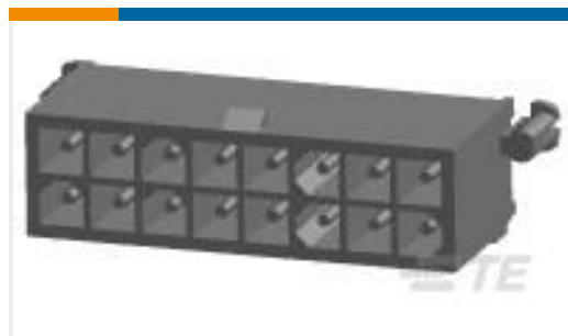
TE 产品编号1-794068-0 16P MINI UMNL HDR W/DH SN