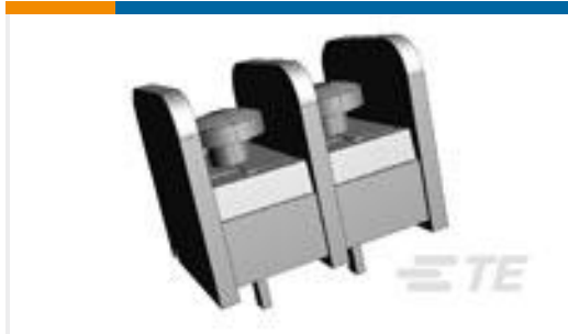
TE 产品编号1437664-4 NC6-P107-02=NC6 ASSEMBLY