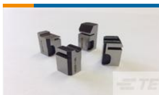
TE 产品编号1803095-1 FLOATING SHEAR, FRONT