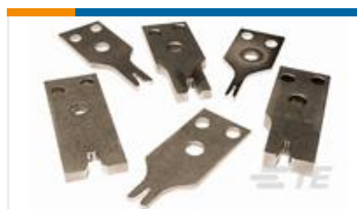
TE 产品编号1803018-8 CRIMPER, INSUL O