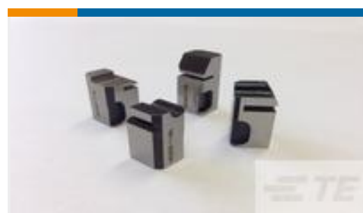
TE 产品编号1803095-1 FLOATING SHEAR, FRONT