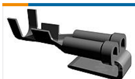
TE 产品编号62003-2 110 FASTON REC 22-18 AWG TPBR