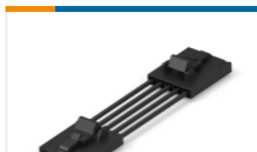
TE 产品编号1-2267795-3 CA, MTE FOW-FOW, 4POS, 300mm 15Au, 24AWG