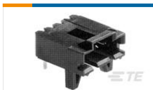
TE 产品编号5-103672-3 04 MTE HDR SRR LATCH W/HLDWN