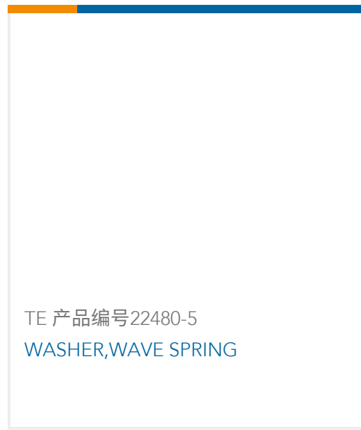
TE 产品编号22480-5 WASHER,WAVE SPRING