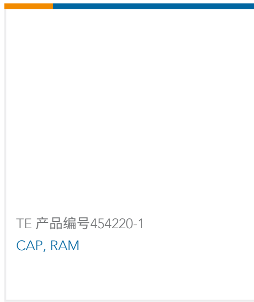
TE 产品编号454220-1 CAP, RAM