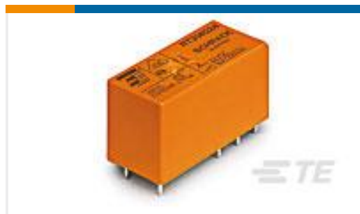
TE 产品编号1649328-4 RTD14012