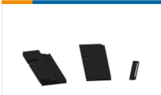
TE 产品编号1-690438-1 FRONT STRIP GUIDE