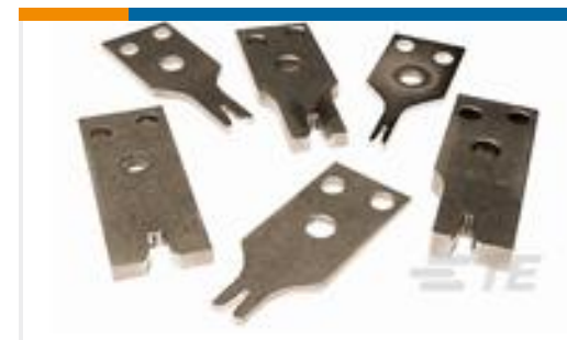
TE 产品编号2014789-1 WIRE CRIMPER, F