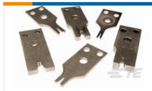
TE 产品编号1-690403-2 CRIMPER INSUL F