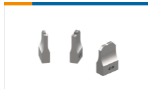
ANVIL REPRESENTATION ONLY TE 产品编号1-720965-2 ANVIL