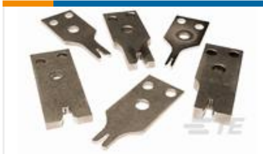
TE 产品编号3-1762943-4 INSULATION CRIMPER, END FEED