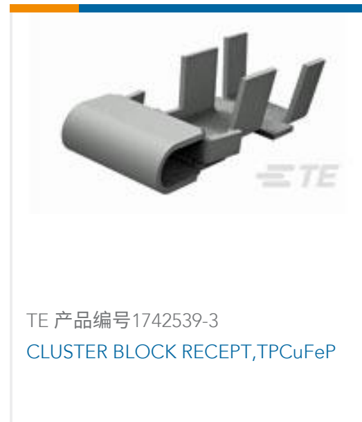
TE 产品编号1742539-3 CLUSTER BLOCK RECEIPT,TPCuFeP