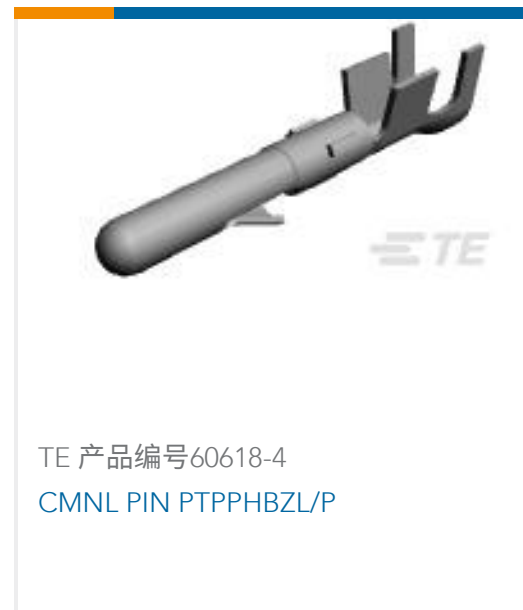
TE 产品编号60618-4 CMNL PIN PTPPHBZL/P