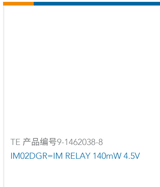
TE 产品编号9-1462038-8 IM02DGR=IM RELAY 140mW 4.5V