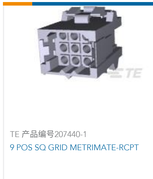
TE 产品编号207440-1 9 POS SQ GRID METRIMATE-RCPT