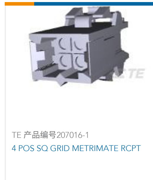
TE 产品编号207016-1 4 POS SQ GRID METRIMATE RCPT