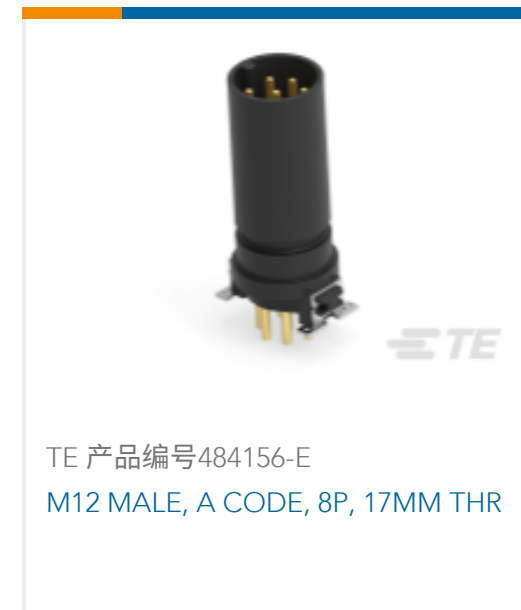
TE 产品编号484156-E M12 MALE, A CODE, 8P, 17MM THR