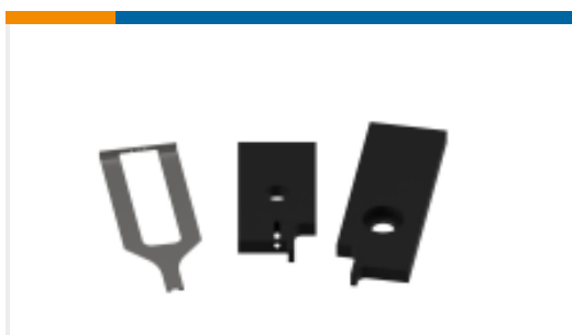
TE 产品编号2119757-4 DEPRESSOR, SHEAR