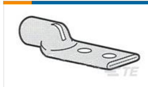
TE 产品编号326805 TERMINAL,AMPOWER 300MCM 3/8