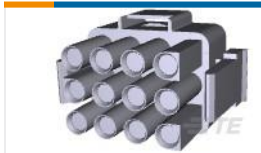
TE 产品编号770041-1 12P UMNL II PLUG-FRONT 94VO