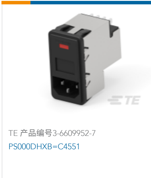
TE 产品编号3-6609952-7 PS000DHXB=C4551