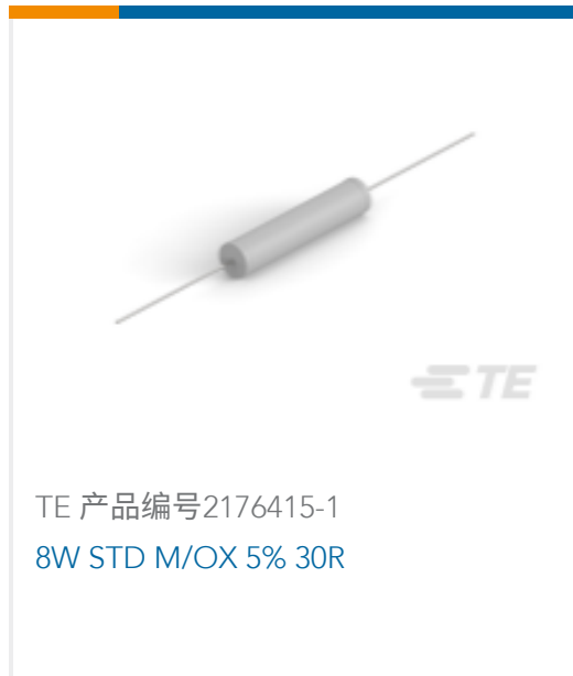
TE 产品编号2176415-1 8W STD M/OX 5% 30R