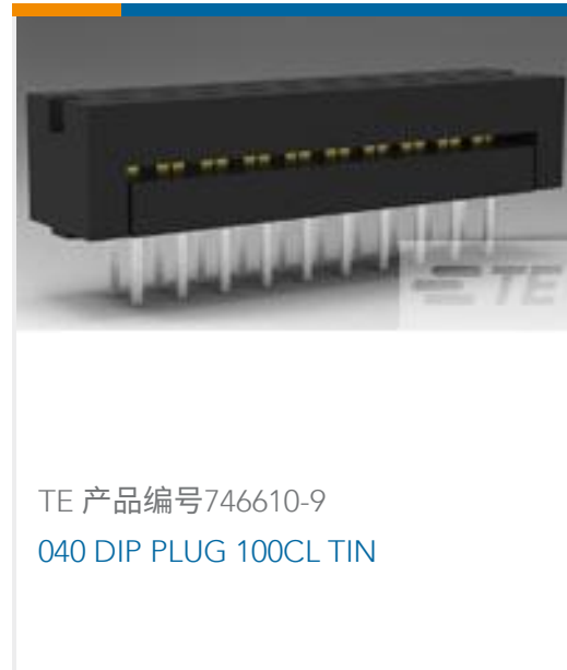
TE 产品编号746610-9 040 DIP PLUG 100CL TIN