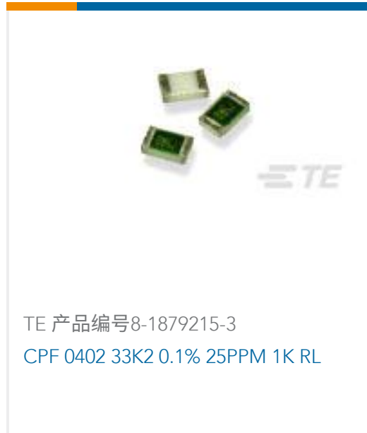
TE 产品编号8-1879215-3 CPF 0402 33K2 0.1% 25PPM 1K RL