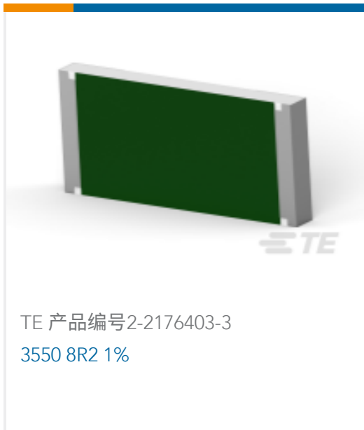
TE 产品编号2-2176403-3 3550 8R2 1%