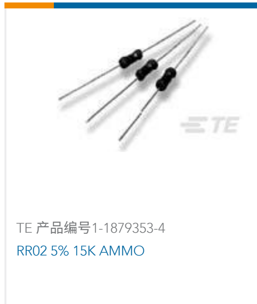
TE 产品编号1-1879353-4 RR02 5% 15K AMMO