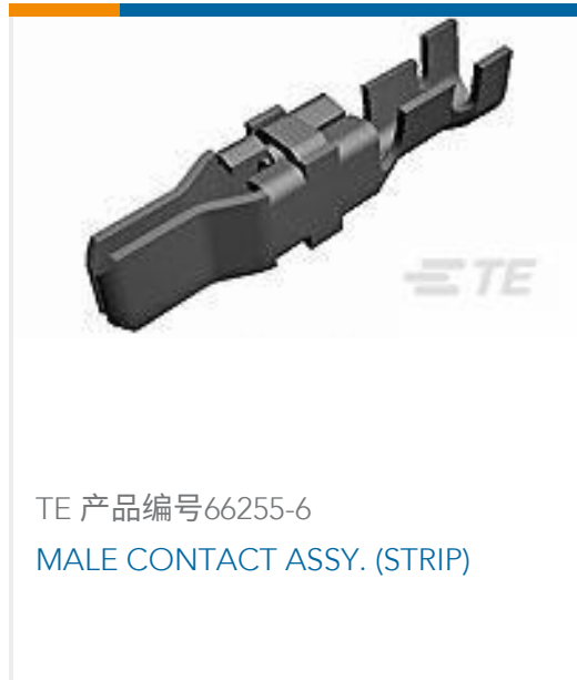
TE 产品编号66255-6 MALE CONTACT ASSY. (STRIP)