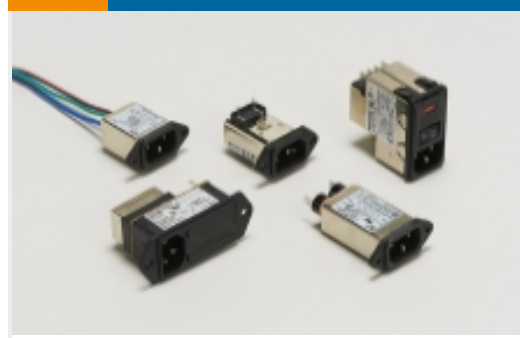
多功能插口式滤波器(368)