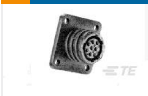
TE 产品编号206433-1 CPC RECPT ASSEMBLY SIZE 11-8