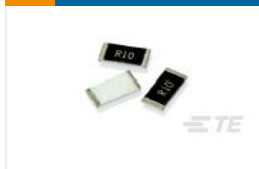
TE 产品编号1-1622824-3 RL73H 2B R68 1% 5K RL