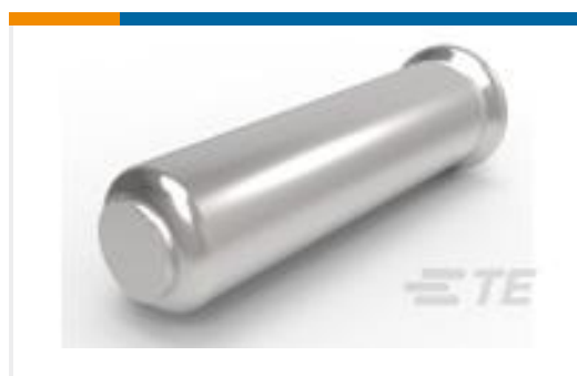
TE 产品编号3-5331272-5 SOCKET,MIN-SPR SN-AU SER-2