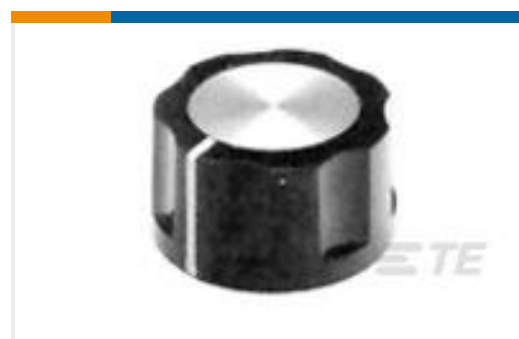
TE 产品编号4-1437624-5 PKE90B1/4=KNOB PLASTIC FLUETED