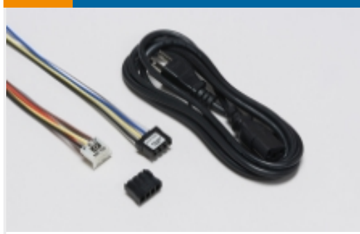
EMI 和 EMC 附件(4)