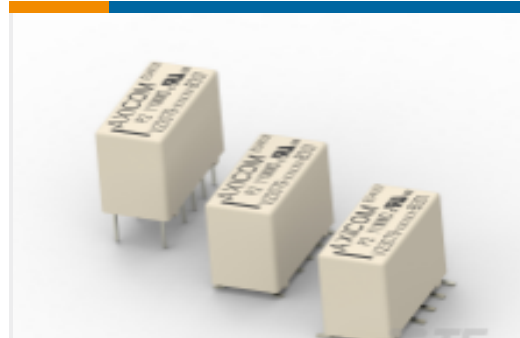
TE 产品编号5-1393789-1 Small Signal Relay, Axicom P2 Standard