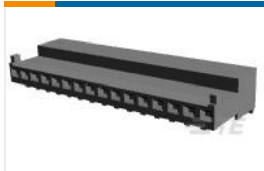
TE 产品编号4-643814-6 16P MTA100 CONN ASSY POL RIB